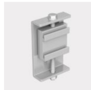
Example of use Clamping cartridge