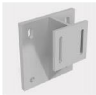
Esempio di utilizzo