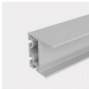
Profilo per cornice K-30V