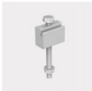
Sistema di bloccaggio K-30V