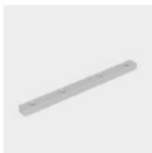
Giunto Lineare con brugole