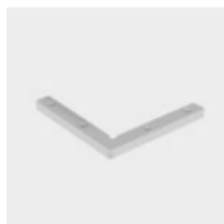
Giunto Angolare con brugole