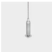
Elemento per appendimento