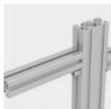
Traversi orizzontali e verticali