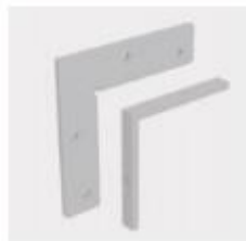
Giunto Angolare con brugole