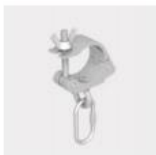
Elemento di appendimento per tubi