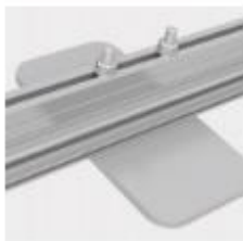
Basamento in ferro verniciato