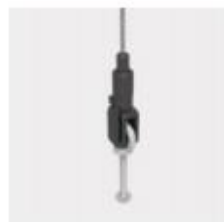
Elemento di appendimento per golfari regolabili