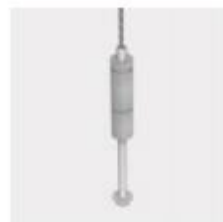
Elemento di appendimento con dado